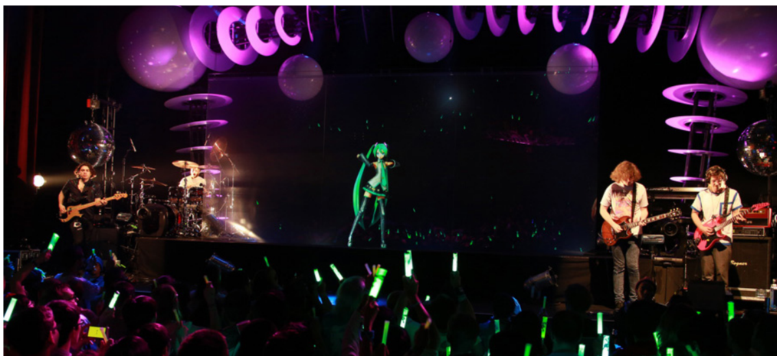
Figura 2 Concierto holográfico Vocaloid ( Hatsune Miku )

Para 2009, la popularidad de Vocaloid creció exponencialmente luego de que la compañía Yamaha, en colaboración con la empresa Crypton Future Media , desarrolla un nuevo y atractivo formato de presentación musical, en donde los personajes Vocaloid fueron proyectados holográficamente en el escenario interpretando su repertorio junto a músicos humanos (Figura 2). Al poco tiempo, comenzaron a llevarse giras mundiales de conciertos holográficos por todo el mundo, incluyendo México, y, sumado al uso de redes sociales, plataformas de streaming y apps de comunicación, el número de fans se acrecentó en múltiples latitudes.